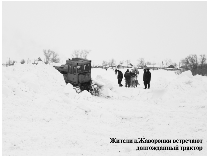
Жители д.Жаворонки встречают долгожданный трактор