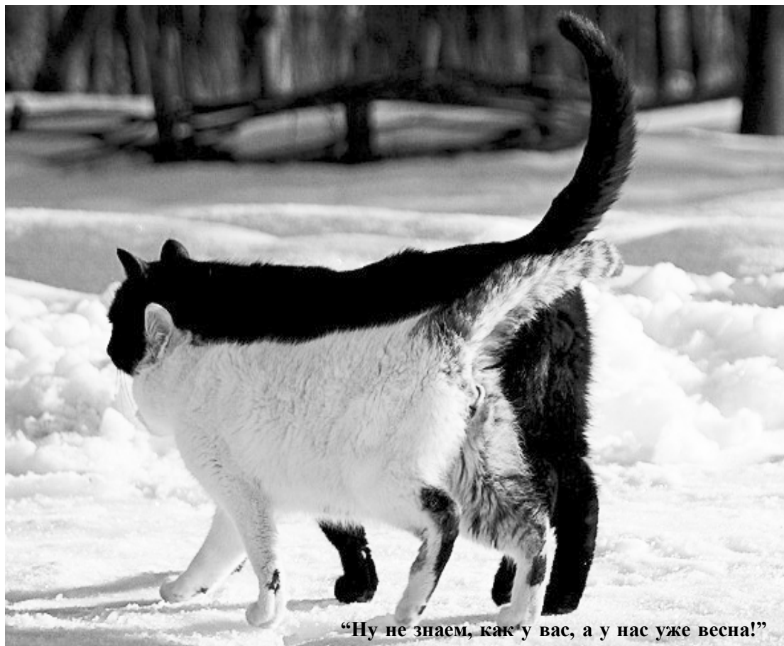
"Ну не знаем, как у вас, а у нас уже весна!"

С одной стороны, это хороший показатель: оптимизм народа не иссяк, и депрессия по поводу затянувшейся зимы, о которой тоже много говорят, не всеобщее явление. Зима затянулась не только у нас, но и в Центральной России, в Сибири и на Дальнем Востоке... На этой неделе синоптики официально объявили: в Россию наконец-то пришла весна. Несмотря на осадки, снег и пока еще низкие ночные температуры, днем градусники будут показывать "плюс".