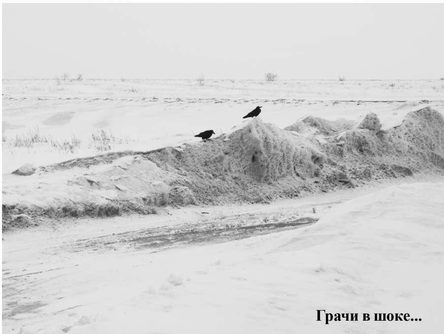
Грачи в шоке...

Наступают тревожные времена для мелких пернатых - фенологи отмечают появление первых коршунов, подза-