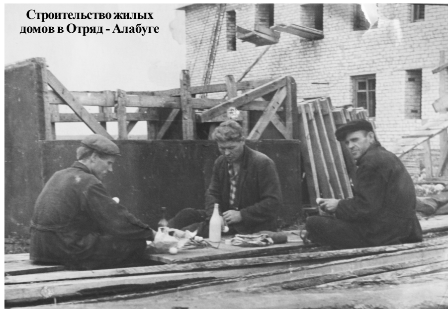
Строительство жилых домов в Отряд - Алабуге